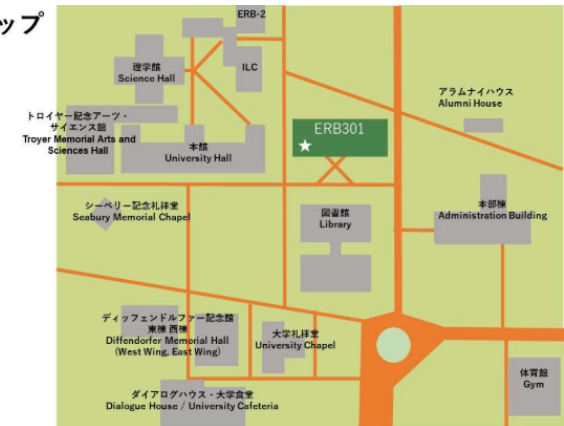
キャンパス・マップ Campus Map

If you have any questions, please come visit us at the Center for Gender Studies. We are located on the third floor of ERB-1 (the building in front of the library). Please check our opening dates on our website, ICU portal or socials. You can also send your questions to cgs@icu.ac.jp .