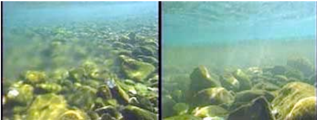
にじんでいるところが海水とまじったところ

2. “ゆらゆら帯”と言われる汽水域は一般的には、川の河口付近にある、“川の淡水”と“海の海水”が混じり合っている所である。川底の勾配が急な銚子川では、川に進入した海水は徐々に勾配に負けながら、やがて止まってしまうようである。先端部は海水が川の流水にまかれている。ゆらゆら帯は、いつも同じ場所にあるわけではい。満干差が最大になる大潮時には最も汽水線が大きく移動する。淡水と海水の境目のユラユラ帯はハッキリとしたままで潮が引き始めるのと同時に後退をし始めました。したがって汽水域は、「海水と真水が混じり合う場所」ではなく、「時々、海になったり川になったりする所」ということになる。