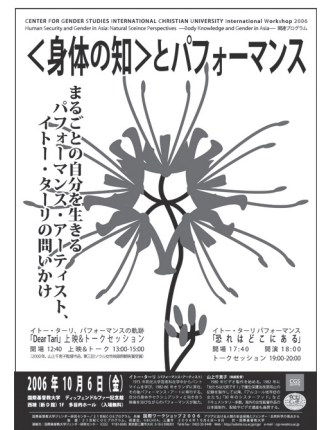
Poster of the Event

I wanted to become more aware of myself. That was why I felt like kicking that breast. If one loses touch with one’s own body and is unable to feel one’s own pain, one might forget the existence of the pain of others beyond one’s own experience. In attempting to establish the place in lesbian sexuality through organizing this event, I had felt a desire to exist by leaning on my fellow lesbians. However, I now wish to establish a place for my own fun sexuality and not a sexuality that relies on someone else. Without doing so, I would not be able to help make a place for others.