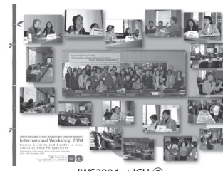
IWS2004 at ICU ⑦

On the third day, the ninth session entitled "Gender and Human Security in Contemporary Asia" summarized the overall results of the workshop and also discussed future research prospects for the field. The session was followed by a coordinators meeting for the Womens Worlds 2005 conference (WW05), in which participants contributed to the discussion