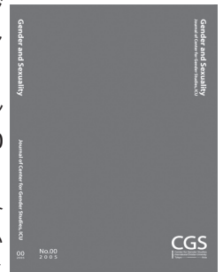
The inaugural preparatory issue No.00 of the CGS journal "Gender & Sexuality"

of specific plans for the conference as well as future directions for issue awareness. After the workshop, there was an optional Tokyo tour led by ICU student volunteers for the overseas participants.