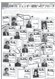
Approach to Gender Studies

2005年4月からICUではジェンダー、セクシュアリティ研究を学際的に学ぶジェンダー・セクシュアリティ研究プログラム (PGSS) がスタートしました。また、春学期からは、