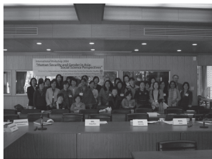
IWS2004 at ICU ①

ICUのキャンパスが紅葉で色づいた11月26日から28日、3日間にわたり、国際基督教大学ジェンダー研究センター(CGS)が主催する第1回国際ワークショップ「アジアにおける人間の安全保障とジェンダー：社会科学の視点から」が開催された。近年世界的に関心が寄せられている「人間の安全保障」は、国民を保護する概念として存在する「国家の安全保障」の限界に挑戦するものであり、どのように「国家」から「人間」へ安全を引き戻せるかという問題提起をしている。ワークショップの目的は2つあり、1つ目は、アジアにおける「人間の安全保障」を、これまであまり注目されてこなかったジェンダーの視点から論じることにより、将来の研究、活動への活路を拓く議論の場をつくること、2つ目は、アジアにおけるジェンダー研究、女性学に携わる研究者・活動家の連携を強めることである。ワークショップには、韓国、台湾、香港、フィリピン、タイ、インド、バングラディッシュといった国々から研究者・活動家が参加し、各国のジェンダー研究・女性学の現状を報告し、現在直面している人間の安全保障の問題をジェンダーの視点から活発に、議論した。