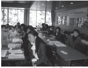
IWS2004 at ICU ⑤