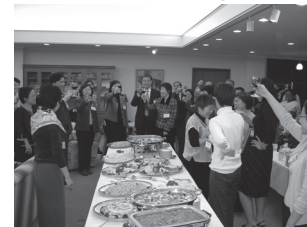
IWS2004 at ICU ③