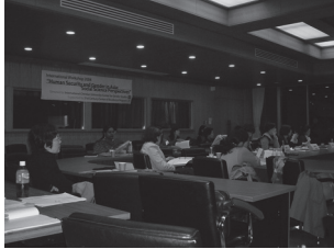
IWS2004 at ICU ⑥

が行われた。安全保障を扱ったセッション5では、香港大学のアイリーン・トン、お茶の水女子大学ジェンダー研究センターの秋林こずえが報告し、梨花女子大学のチャン・ピルファをコメンテーターに、人間の安全保障の意義についての議論が行われた。ジェンダーの視点から経済に注目したセッション6は、インドネシア大学のクリスティー・パウワンダリーとダッカ大学のタスニーム・シディスキの2