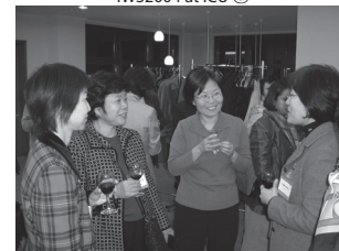
IWS2004 at ICU ④